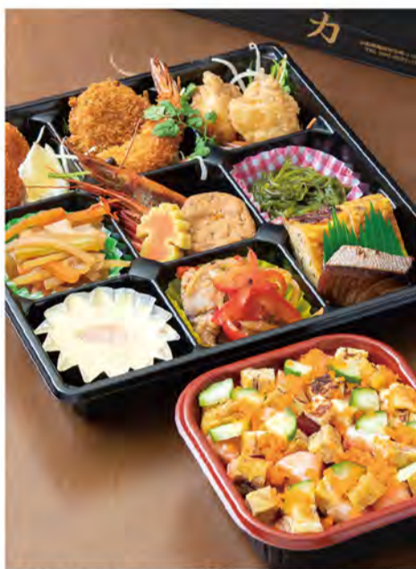
テイクアウト「ちから膳(ばらちらし付き)」1,800円。前日まで要予約。

旬の海鮮料理が人気の「sushi 力」では、お雑様の季節にふさわしい華やかなばらちらしを今年もご用意! 人気のテイクアウト折詰膳「ちから膳」の小丼を、この時期のみ「ばらちらし」に変更可。まぐろや海老、サーモンなど具沢山のばらちらしは満足間違いなし! また新登場の「お手軽弁当シリーズ」も人気。「ミックスフライ弁当」がオススメで、エビフライ、チキンカツ、特大メンチカツのトリオに加え、オススメの魚フライが1~2種類入ってなんと価格は600円! 店頭注文のほか、電話での事前予約もOKです。