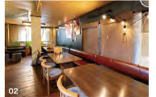
01 読者予約特典のフレンチハニートースト。 02 ゆったり過ごせるカジュアルな店内。

ビーク女子会プランご予約時「ビーク見た!」で フレンチハニートースト(人数分)サービス