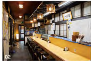
01 アイス・フルーツ・コーヒーを人数分サービス。 02 週末の夜は深夜2時まで営業!