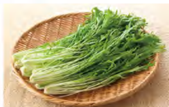
葉先がピンとし、緑と白がはっきりしているものを選びましょう。

トッピングの具がたくさんで、味付きのおかゆが香港流。シャキシャキの水菜にピリッと辛い明太子を絡めて美味しい!ピーナッツの香ばしさも食欲をそそります。お好みでパクチーや小ネギなどを加えるのもオススメです。食欲の無い時や朝食にもピッタリなので、ぜひ試してみてください♪