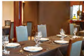
01 「ワンプレートランチ」1,800円。(平日限定) 02 店内貸切の宴会可。飲み放題込み7,000円。