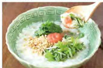
お好みでパクチーをのせると、より香り高い香港がゆに。