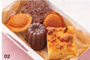
01 「自然派グラスワイン3種セット」2,500円。 02 「焼き菓子BOX」900円(土・日・月限定)