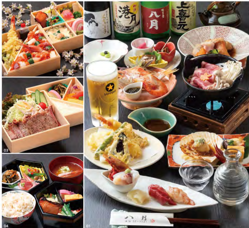
01 「歓送迎会飲み放題コース」5,500円(4名様より・要予約)。通常6,000円の飲み放題コースが500円お得に! 飲み放題の時間は17時半~21時(20時半L.O.)。期間は4月末まで。02 「雛ちらし弁当」2,500円。03 「牛ステーキ弁当」2,500円。04 「日替わり二段重」1,050円。

味工房 八月 酒田市中町3-9-1 ☎0234-22-1721 営/11:30~13:00(L.O.) 17:30~21:00(L.O.) 休/日曜、他