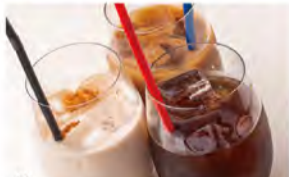
01 予約特典で自家製デザート人数分サービス。 02 予約特典でカフェメニューも飲み放題に!

ビーク女子会コースご予約時「ビーク見た!」で デザートサービス&飲み放題120分が150分に! カフェメニューも飲み放題に! 期間: 2/28(金)~3/31(月)まで。