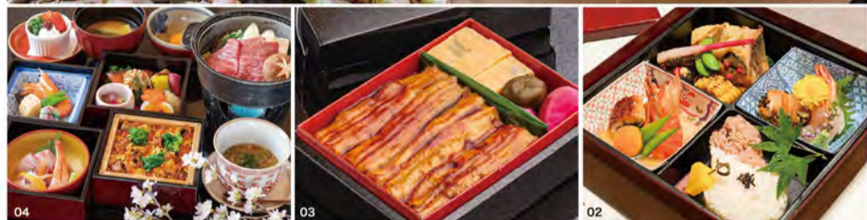
01 春限定のお弁当「雛わっぱ」2,200円。4/3までの限定販売、2日前まで要予約。ばらちらし(1段目)のみは1,200円。02 お刺身が付いた「松花堂弁当」2,000円。03 「国産うなぎ弁当」3,600円。04 春限定ランチ「雛弁当」3,000円。4/3まで、2日前まで要予約。2名様から。