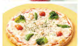
01 種類豊富なオリジナルドリンク。 02 ピッツアのテイクアウトも可能(要予約)。

プリマヴェーラコースご注文時「ビーク見た!」で ウェルカムドリンクサービス 期間: 2/28(金)~3/31(月)まで。