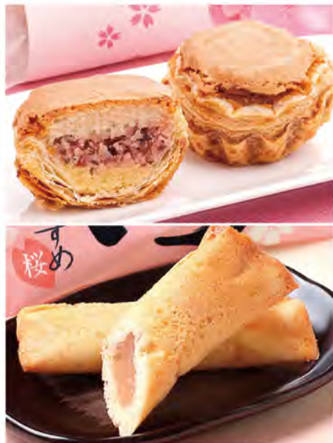
桜咲くサクパイ 320円。 酒田むすめ(桜) 170円。