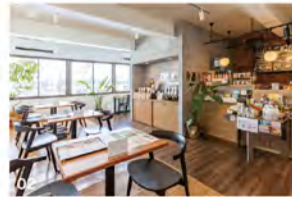
01 予約特典で「スムージー」734円が人数分無料。 02 お店は1Fドアをくぐり、アラオヤ2Fへ。