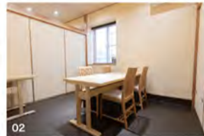
01 オススメのランチ「ぜいたく重梅」1,350円。 02 寛げる個室。ディナーのアラカルトも充実。